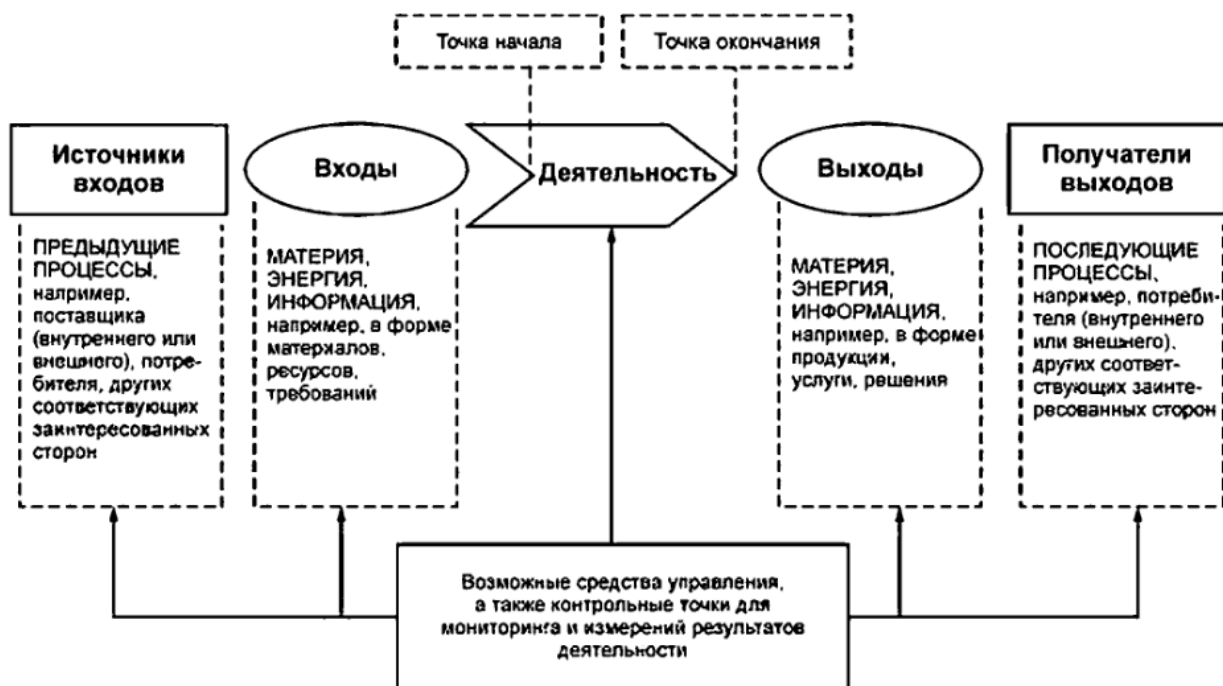
"Рисунок 1 - Схематичное изображение элементов процесса"

Рисунок 1 дает схематичное изображение любого процесса и иллюстрирует взаимосвязь элементов процесса. Контрольные точки мониторинга и измерения, необходимые для управления, являются специфическими для каждого процесса и будут варьироваться в зависимости от соответствующих рисков.